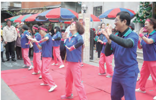
▲懷仁天主堂帶動讚美操的活力演出。

天主派遣祂的愛子耶穌來到世上，為了愛世人到今世終結。一份徹底愛到底的愛，也這樣告訴我們：「你應當愛近人，如你自己。」（瑪22:39）打從領洗的那一時刻起，我們每一位都是祂的愛子，祂的門徒。我們也要去使萬民成為門徒，將這份愛的好消息傳給身邊的人，讓更多人來成為我們教會大家庭的一分子。