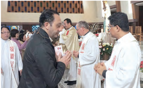
▲外國友人也來參與盛會，領受聖母聖衣。