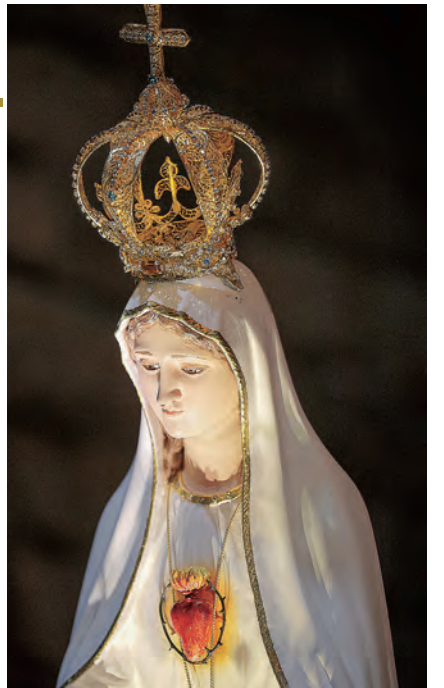
▲后冠十字架與聖母聖心滿溢恩寵，輝映母愛慈顏，天主子民何等有福！