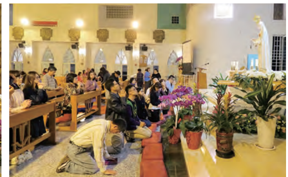
▲天主子民跪立於法蒂瑪聖母態像台前，靜靜傾訴子女依恃之情，祈求萬福后代禱。