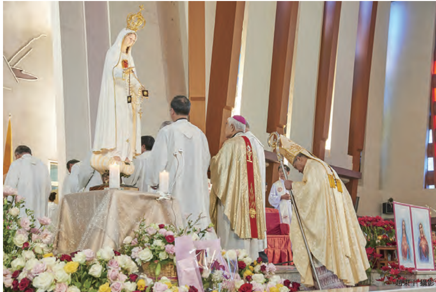
▲2月21日聖家堂舉行的法蒂瑪聖母態像巡台中，神長們依序在法蒂瑪聖母台前獻上孝敬之意。