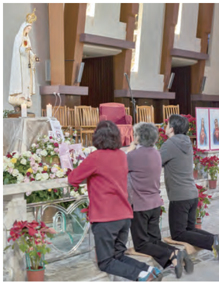
▲教友們跪立在聖母台前，殷殷祈禱。