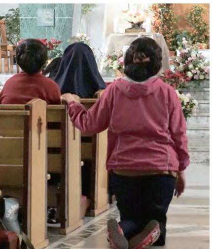
▲長跪祈禱，不畏磨石地面的冰冷堅硬。