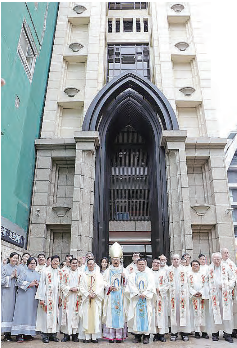
▲大家歡喜地一起見證美麗的蘭雅聖母顯靈聖牌朝聖地誕生