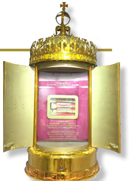
▲26位殉道聖人中的3位的聖髑盒 ▼雲仙地獄谷百人殉教紀念碑彌撒後合影