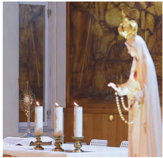
▲遵從聖母指示，天主子民在聖體皓光下徹夜祈禱，陪伴聖母。