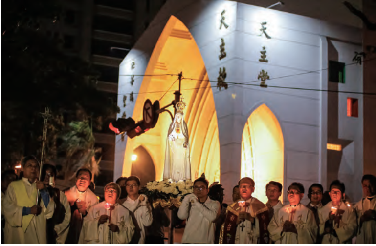
▲聖母遊行從台中市雙十路法蒂瑪聖母堂啟程，為都會、為在地綻放光明希望。