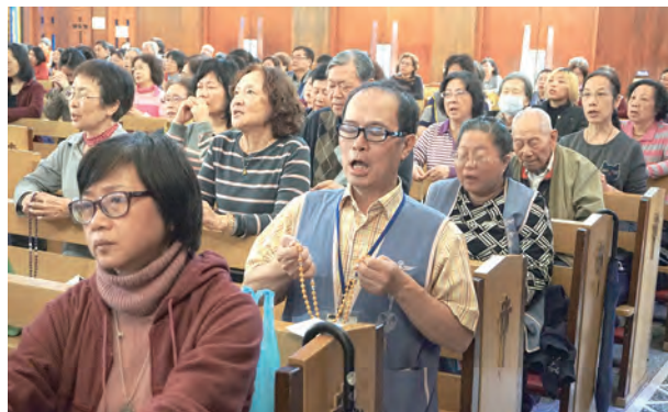
▲教友們誦唱慈悲串經，聲聲祈禱，直達天聽。