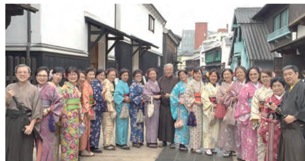
▲穿越時空·出島和服初體驗

參觀教堂吸引我的，不是華麗的建築物，而是離鄉背井在地深耕的外籍傳教士，跨越語言文化種族障礙幫助貧窮邊緣族群，撫慰孤獨無依的靈魂，當我思索著偉大情操的動力從何而來？要忍受多少挫折時竟淚