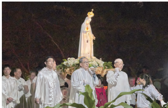
▲法蒂瑪聖母態像遊行，遊行聖家堂周邊及大安森林公園。