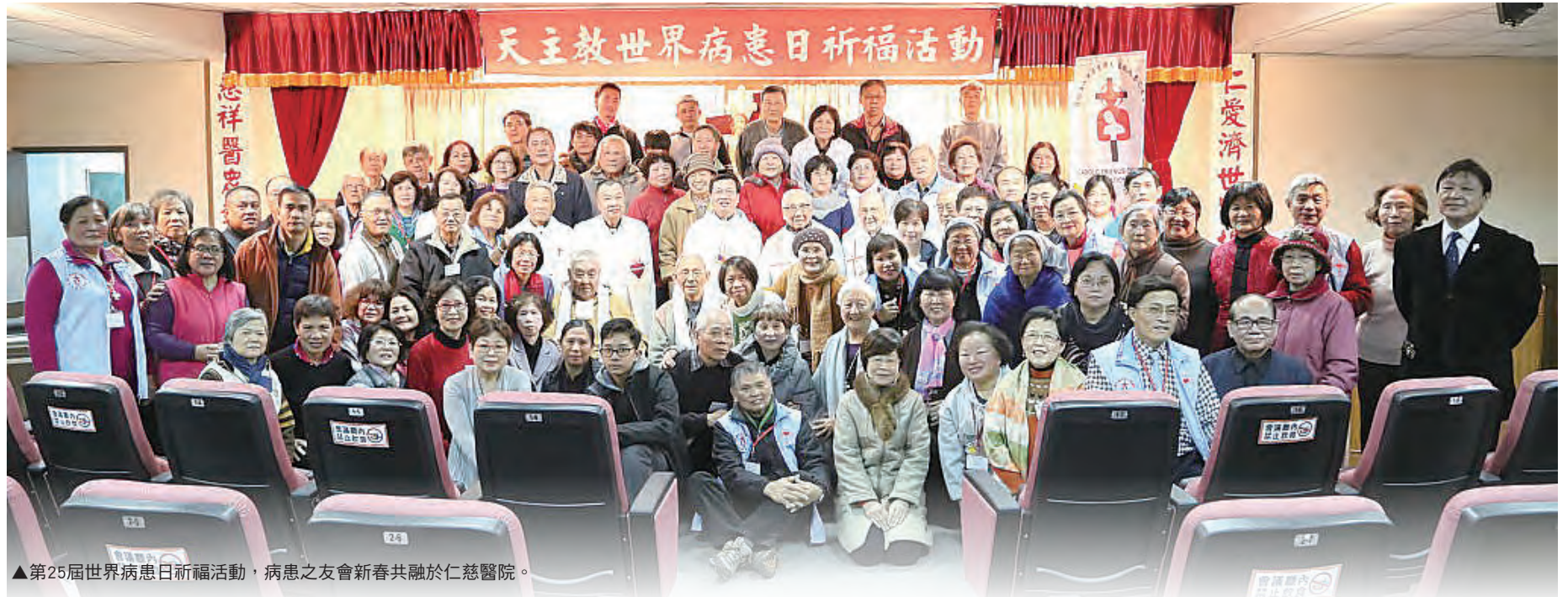
▲第25屆世界病患日祈福活動，病患之友會新春共融於仁慈醫院。