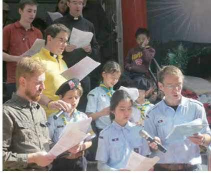
▲法國團體獻唱法文聖歌，精彩動聽。