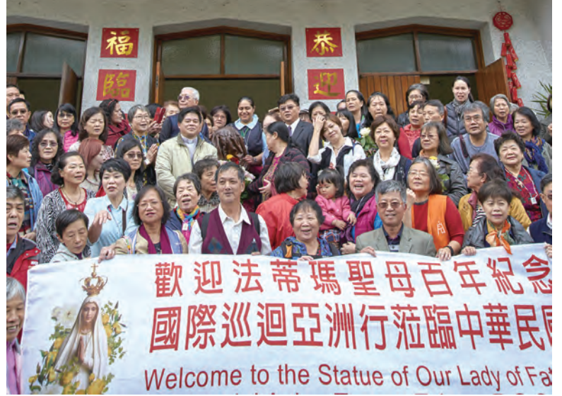
▲台中教區數十位教友包遊覽車北上，盛大迎接法蒂瑪聖母態像巡訪台中教區，而台北總教區的神長和教友更依依相送。