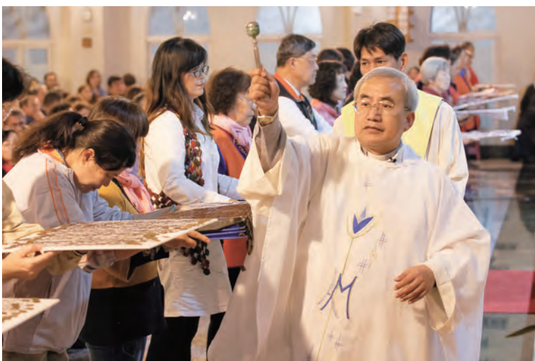
▲幸朝明神父一一為聖母聖衣灑聖水祝福，藉以分施聖母恩寵給她的子女們。