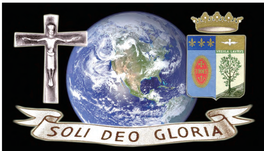
▲全球聖吳甦樂羅馬聯合會的十字架：復活的基督 全球聖吳甦樂羅馬聯合會的會徽：唯主是榮。