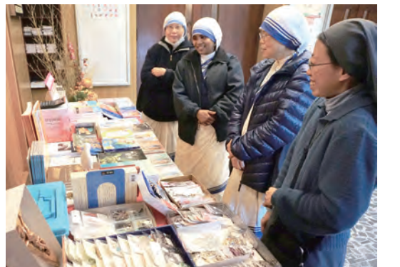
▲仁愛傳教修女會修女選購上智發行有關法蒂瑪聖母的出版物