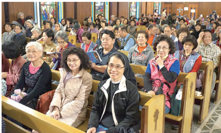
▲聖母遊行結束後，教友們不覺疲累，仍然喜樂地回到聖家堂，繼續參加晚禱。