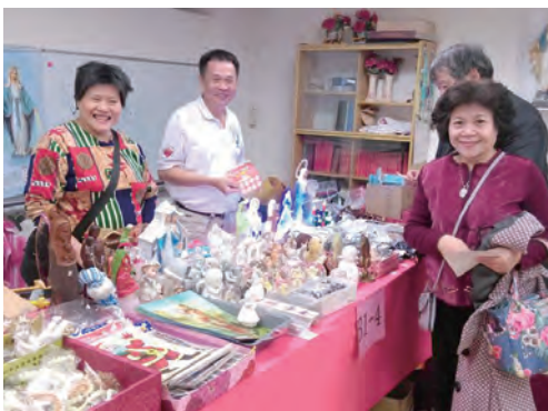
▲主佑聖教文物中心贊助義賣