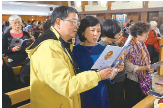
▲已婚信友們起立，同聲誦念夫妻的貞潔承諾。