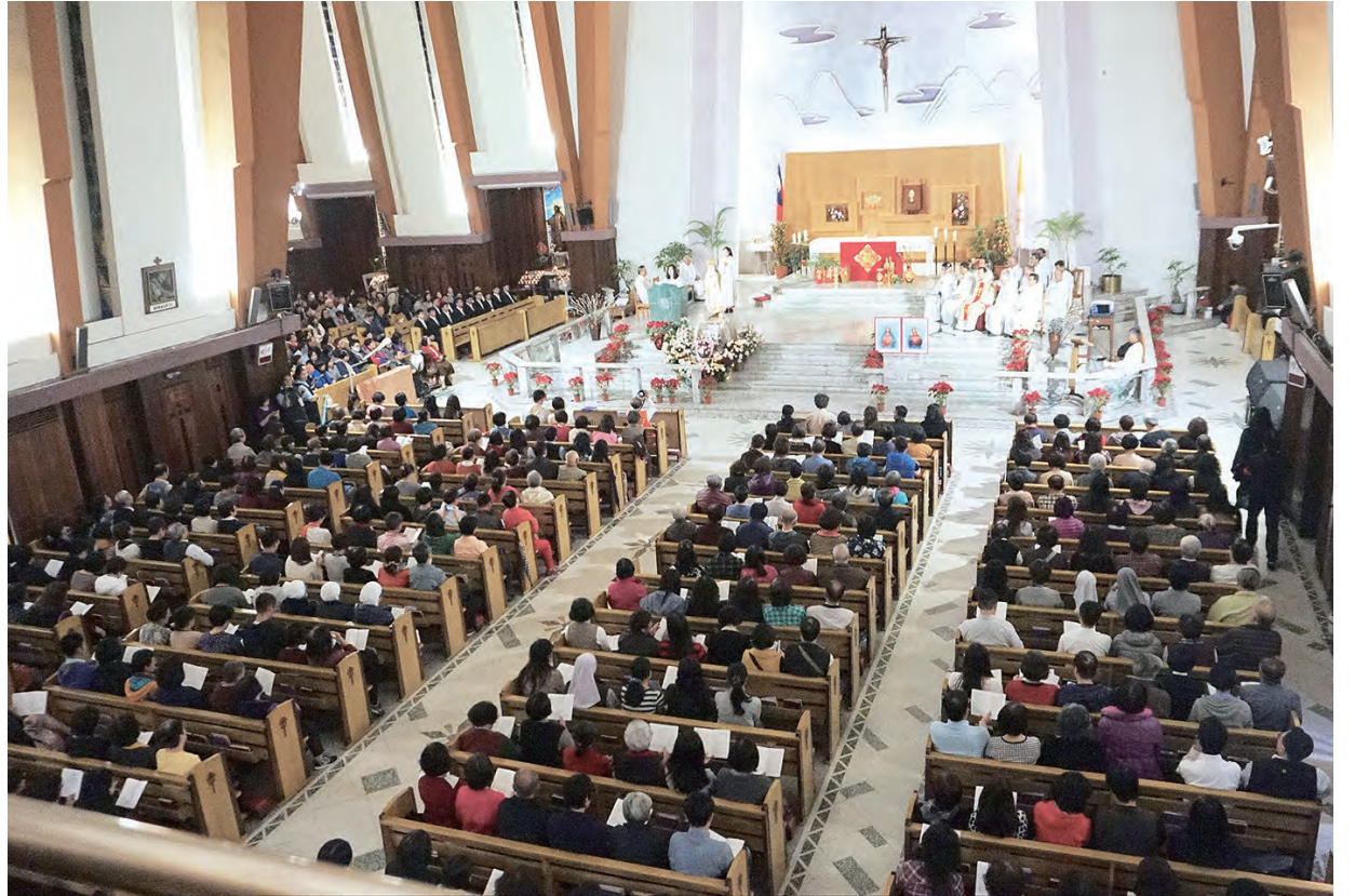
▲法蒂瑪聖母態像巡駐聖家堂的第2天，2月20日晚間敬禮聖母彌撒仍然滿座，千百信友一同親炙聖母隆恩。