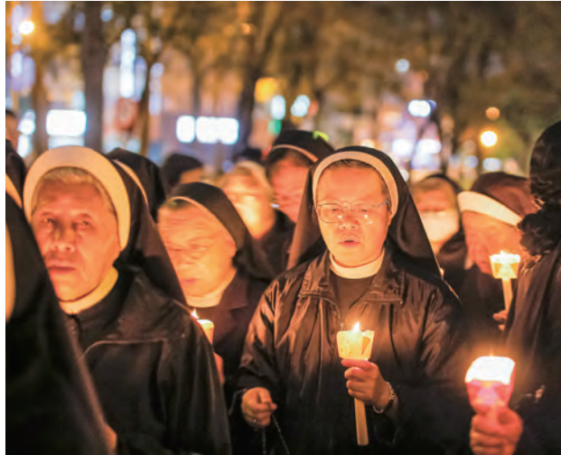
▲修女們手持聖母燭光遊行，見證犧牲奉獻的光鹽使命。