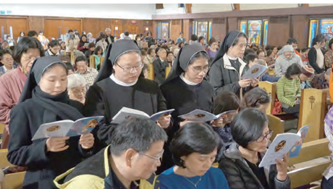
▲所有度獻身生活者起立恭誦〈持守貞潔的許諾〉禱文