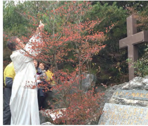
▲在雲仙地獄谷的百人殉教紀念碑前舉行戶外彌撒 ▼日本二十六聖人殉教紀念碑