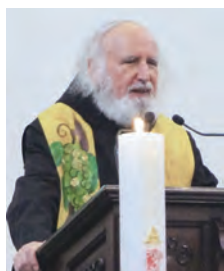
▲古倫神父長達50分鐘的「慈悲與正義的社會醫治與轉化」講道，全場動容。