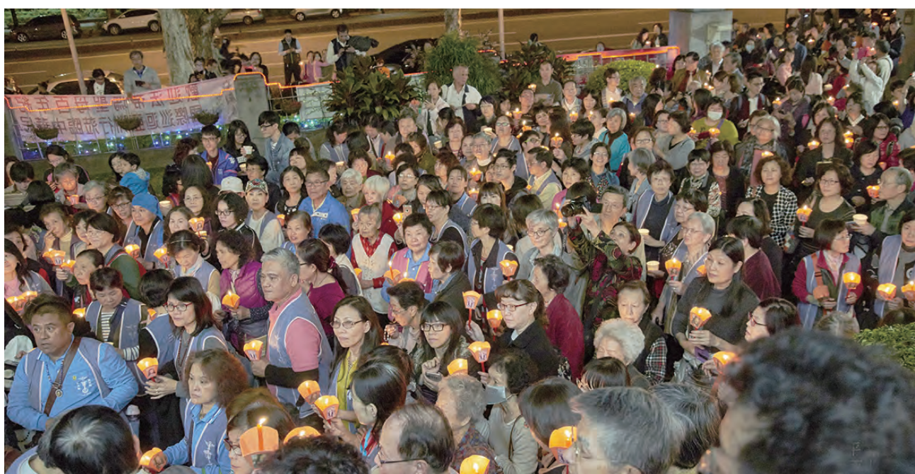
▲千百教友和聖母軍手持聖母燭光，緊緊跟隨在法蒂瑪聖母態像之後遊行祈禱，因著萬福聖母媽媽的代禱，天主救恩臨分施給眾人。