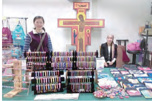
▲原住民文化教育協會義賣手工藝品，琳瑯滿目。