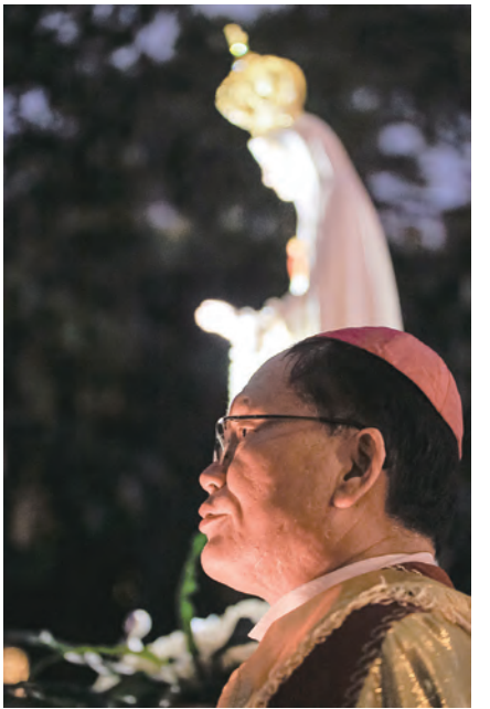
▲台中教區蘇耀文主教2月23日晚間帶領神父、修女和教友們在雙十堂外的綠園道舉行聖母遊行，為全國全民祈禱，更為基督信仰作見證。