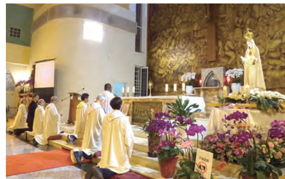
▲2月21日至2月24日，聖母態像駐訪台中教區期間，每晚都以明供聖體展開守夜祈禱。