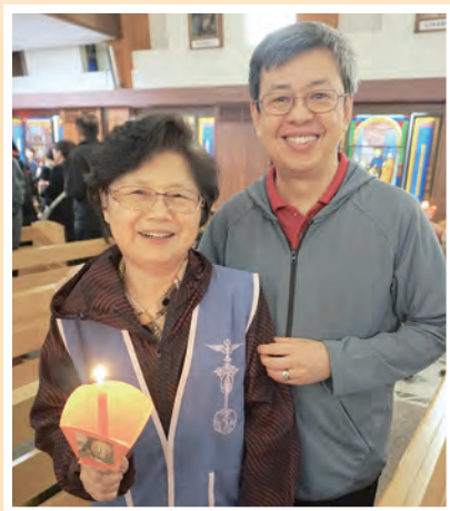
▲副總統伉儷陳建仁爵士、羅鳳蘋姊妹奉行整個家庭奉獻予聖家，並參加聖母遊行。