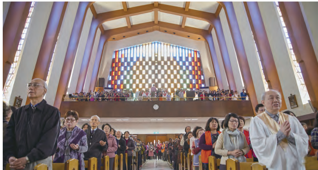
▲2月21日上午，在法蒂瑪聖母態像繼續南下巡訪其他教區前，逾千名教友齊聚台北聖家堂參加彌撒，瞻仰聖母慈容，分靈聖母代禱的滿滿恩寵。