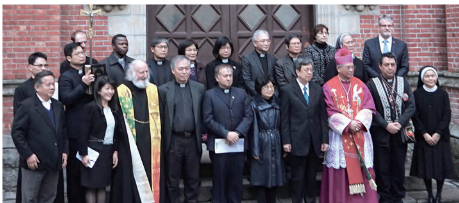
▲228和平紀念日和好禮拜參禮的神長、牧師和陳建仁副總統伉儷在台北市濟南基督長老教會合影。

全體參禮者在齊唱〈天主經〉之後，互道平安，由洪總主教為大家降福，圓滿完成慈悲與正義和好禮拜。