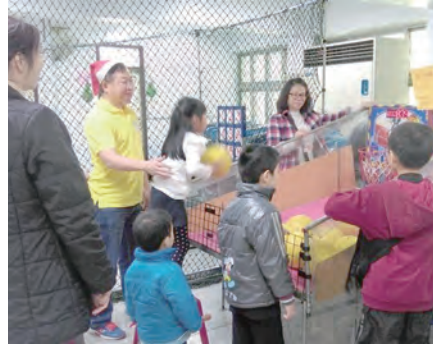
▲遊戲攤位親子同樂