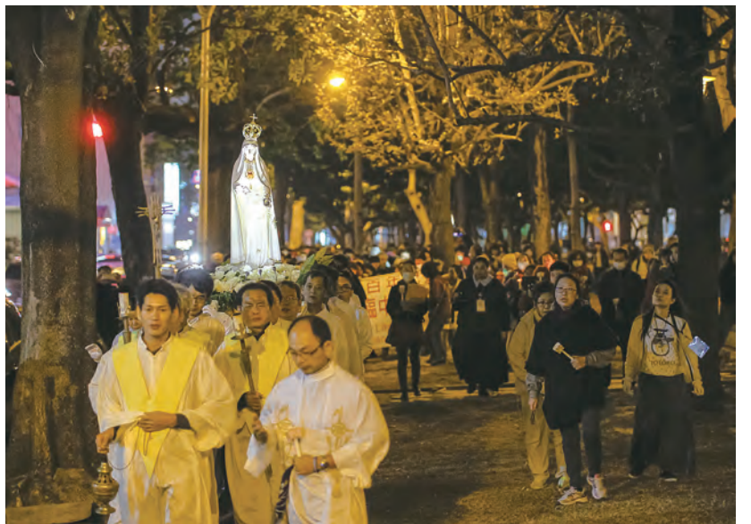
▲綠園道上，寒風襲人，子民同心，聖母同行，人生順遂，光明指引，恩寵滿盈。