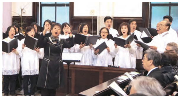
▲指揮蘇開儀姊妹帶領瓦器合唱團作禮儀音樂服事 ▲陳建仁副總統恭引復活蠟的薪火，點燃和平之燭。