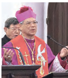
▲洪山川總主教帶領全體詠唱《天主經》虔誠祈禱。

因此，眾人應改變對移民和難民的態度，從丟棄文化的防衛或害怕、冷漠或排斥轉變為以相遇文化為基礎的態度。唯有相遇的文化，才能建設一個更公正和友愛的世界，一個更美好的世界。