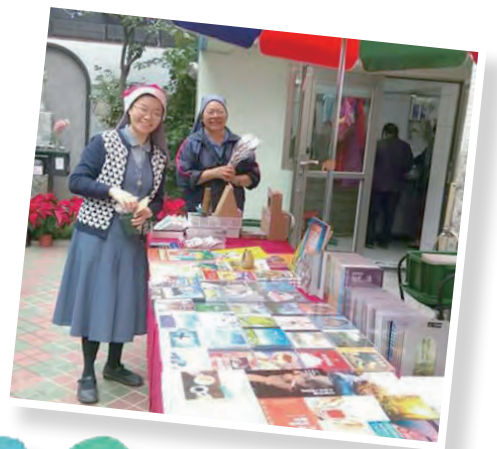
▲聖保祿孝女會修女帶來上智文化的優良出版品，頗受歡迎。