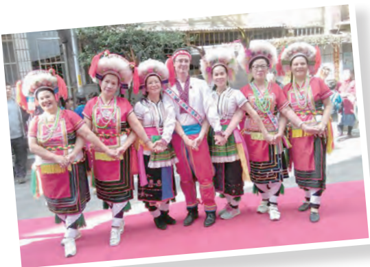
▲原住民歌舞表演後歡喜合影