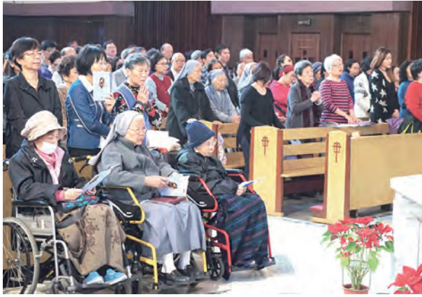
▲信友踴躍參與敬禮聖母彌撒，即使行動不便也無所阻攔。