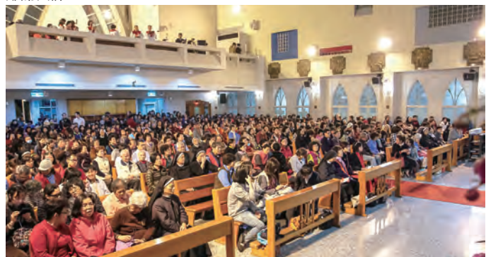
▲法蒂瑪聖母態像福臨台中教區，主內肢體齊聚一堂，效法聖母，共頌主恩，同聲祈禱。