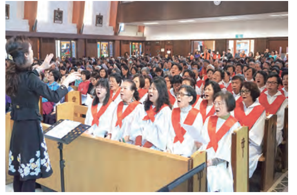
▲多達54人的聯合聖詠團，為彌撒禮儀作最好的音樂服事。