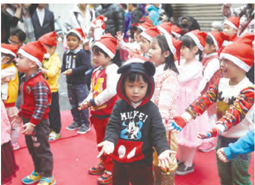
▲可愛活潑的玫瑰幼兒園小朋友