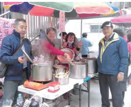
▲板橋懷仁天主堂贊助義賣，精神可佩。