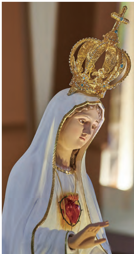
▲法蒂瑪聖母態像巡訪台北聖家堂，慈暉柔光，綻映聖堂，滿被恩寵。

法蒂瑪聖母態像巡台行程第2站來到台北聖家堂。由於聖家堂位於首善之都的首善之區，聖母態像駐訪聖家堂的3天期間，當是聖家堂的朝聖人潮與敬禮活動盛況空前，每台敬禮聖母彌撒至少有2000位教友參禮，在聖母台前祈禱的子民更是日以繼夜地從未間斷。